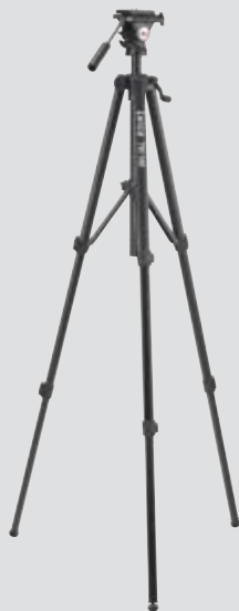
Leica TRI 100 Stativ Art. Nr. 757 938