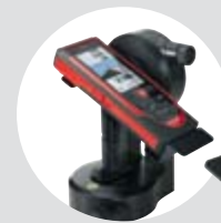
Leica FTA360-S Adapter Art. Nr. 828 414