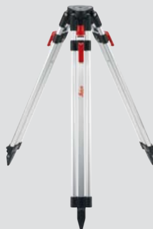
Leica TRI 200 Stativ mit 1/4" Gewinde Art. Nr. 828 426