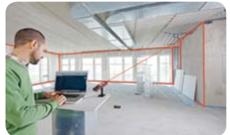
Echtzeitübertragung von Punkt-Koordinaten