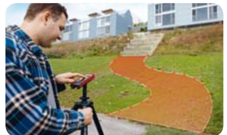
Messen von Punkten und Flächen