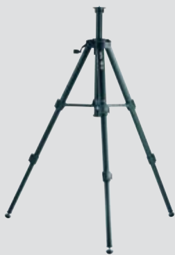
Leica TRI 70 Stativ Art. Nr. 794 963